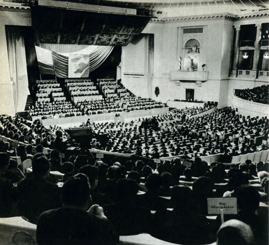
VI съезд ПОРП, проходивший в декабре 1971 года, принял Резолюцию по вопросу безопасности и сотрудничества в Европе.