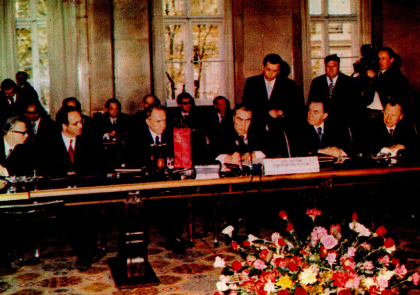
Союза Советских Социалистических Республик — Л.И. Брежнев — Генеральный секретарь ЦК Коммунистической партии Советского Союза; А.Н. Косыгин — Председатель Совета Министров Союза Советских Социалистических Республик;