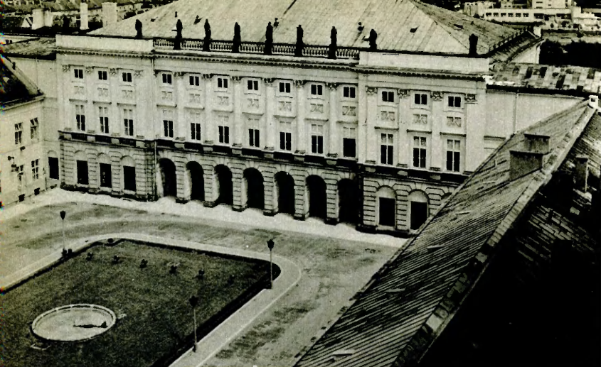
Здание Президиума Совета Министров в Варшаве, в котором 14 мая 1955 года европейские социалистические страны подписали исторический Договор о дружбе, сотрудничестве и взаимной помощи.