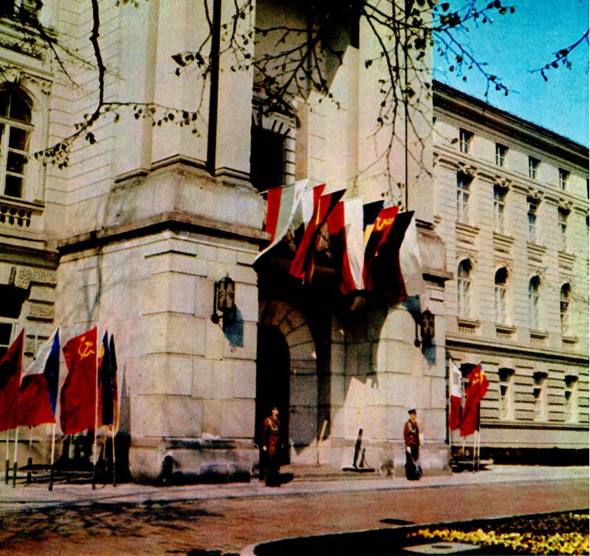
Здание Совета Министров в Варшаве, где 17—18 апреля 1974 года проходило совещание Политического консультативного комитета государств — участников Варшавского Договора.