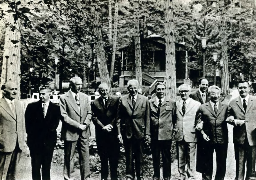
Дружеская встреча руководителей коммунистических и рабочих партий социалистических стран в июле 1973 года в Крыму. На встрече была вновь подчеркнута важность более тесного всестороннего сотрудничества между братскими странами в интересах дела социализма и укрепления мира.