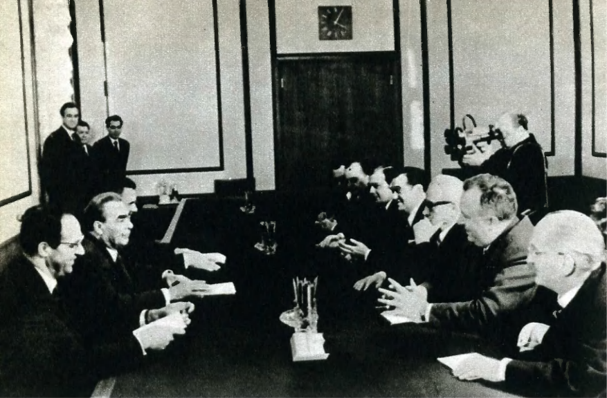
Москва, Кремль, 16 января 1973 года. На встрече с участниками совещания министров иностранных дел государств — участников Варшавского Договора Генеральный секретарь ЦК КПСС Л.И. Брежнев говорил о необходимости единства действий социалистических стран в борьбе за осуществление Программы мира.