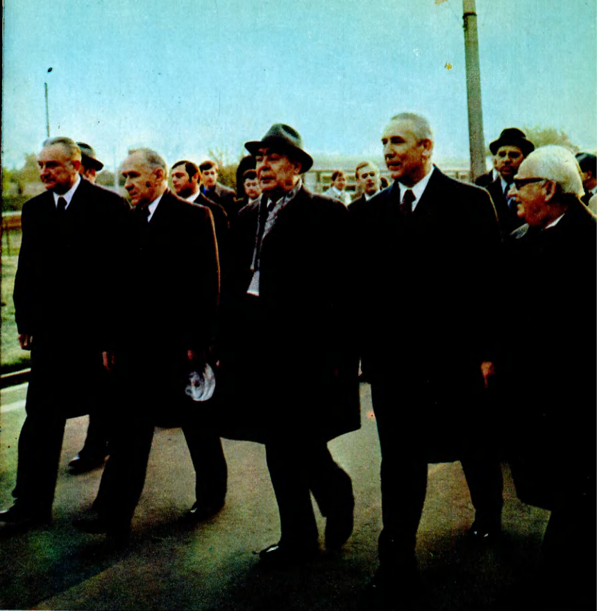
Встреча советской делегации на Гданьском вокзале Варшавы. Советская делегация, возглавляемая Генеральным секретарем ЦК КПСС Л.И. Брежневым, прибыла в Варшаву для участия в работе очередного совещания Политического консультативного комитета государств — участников Варшавского Договора.