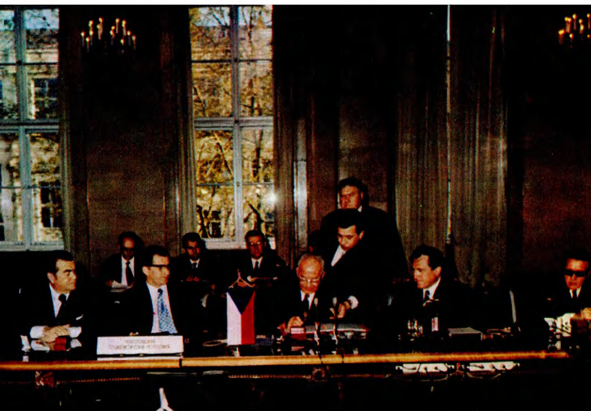
Чехословацкой Социалистической Республики — Густав Гусак — Генеральный секретарь ЦК Коммунистической партии Чехословакии; Любомир Штроугал — Председатель правительства Чехословацкой Социалистической Республики