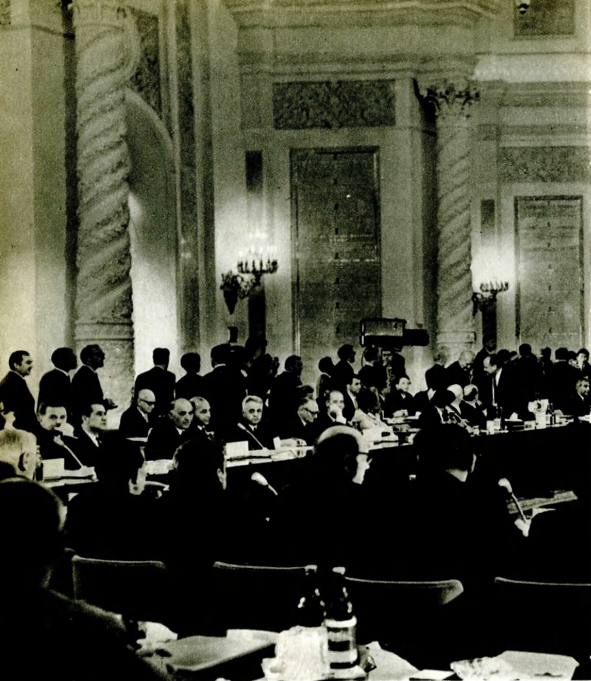
Международное совещание коммунистических и рабочих партий, состоявшееся в июне 1969 года в Москве, с новой силой подчеркнуло необходимость единства действий всех антиимпериалистических сил.